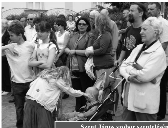
Szent János szobor szentelésén

tett a Nepomuki Szent János szobrának felújítására, környékének a rendbetételére. Együtt munkálkodott a katolikus gyülekezet, az önkormányzat, civil szervezetek, művészek és sok-sok ember fizetség nélkül. Az összefogás ereje mozgatta oda azokat az anyagokat, amelyek most ott ékítik a teret, melyek most ott segítik az örök gondolat, a nagyszerűség felmutatását. Ott álltunk közel kétszázan, tisztelettel, nyugalomban, közösséget érezve. Minden egyszerű volt, őszinte, mindent magunkénak éreztünk. Nem volt ott semmi harsányság, hivalkodó, zajos. Tudom még ezek a szavak sem illenek ide, de oly sokszor lehet tapasztalni ezeket máskor.