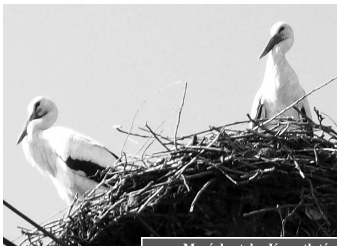
Megérkeztek - Kossuth tér