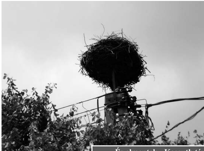
És elmentek - Kossuth tér