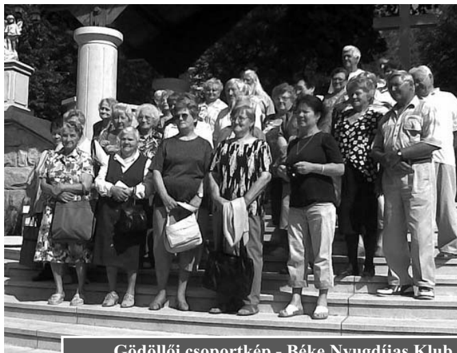
Gödöllői csoportkép - Béke Nyugdíjas Klub

Májusban kirándulást tettünk Gödöllőre. Első állomásunk a máriabesnyői kegytemplom volt, melyet Grassalkovich Antal épített ott, ahol csodálatos körülmények között, egy elefántcsontból faragott, 11 cm magas Szűz Mária-szobrocskát találtak.