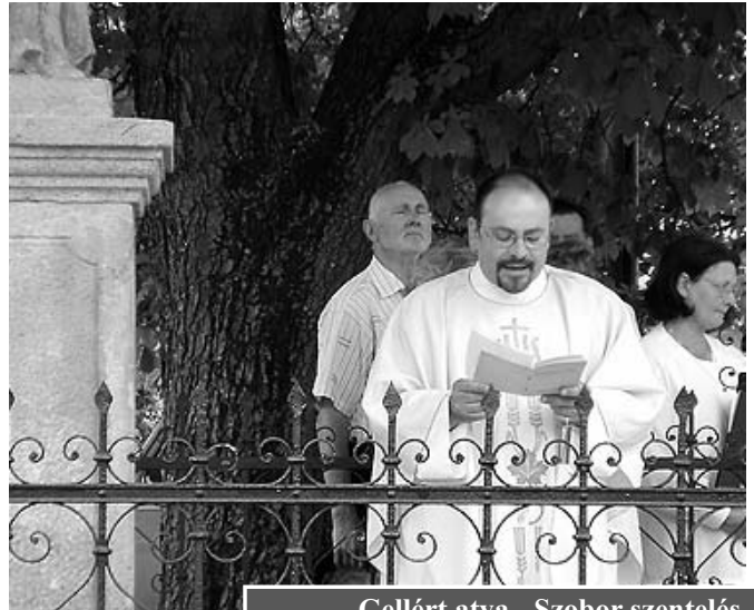
Gellért atya - Szobor szentelés

A szigetmonostori Római Katolikus Egyház, közösségi összefogással, a Szigetmonostori Önkormányzat és számos civil személy közreműködésével felújította és 2009 május 24-én megszentelt, fő utcai Nepumuki Szent János szobrot, az árvízi védőszentet.