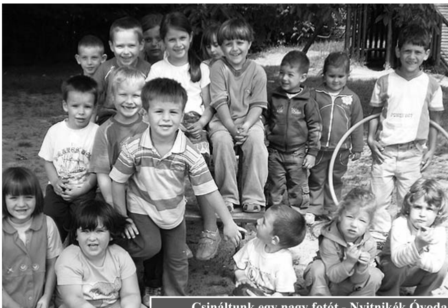
Csináltunk egy nagy fotót - Nyitnikék Óvoda

A 2009/2010-es nevelési évre jelentkezők száma 39 fő volt. Az induló csoportba felvehető gyermekek száma 23 fő, egy tanköteles korú gyermeket a nagycsoport fogad. A gyermek felvételéről mindig az óvodavezető dönt, amennyiben a jelentkezők száma meghaladja a férőhelyeket bizottságot szervez, amely javaslatot tesz a gyermekek felvételére. A bizottság tagja lehet a védőnő, az óvodavezető, az óvoda gyermekvédelmi felelőse, és a szülők közösségének képviselője. Az elmúlt években az önkormányzat képviselőjében is egy fő a képviselő-testületből részt vett. (A részletek az újság 24. oldalán olvashatóak.)