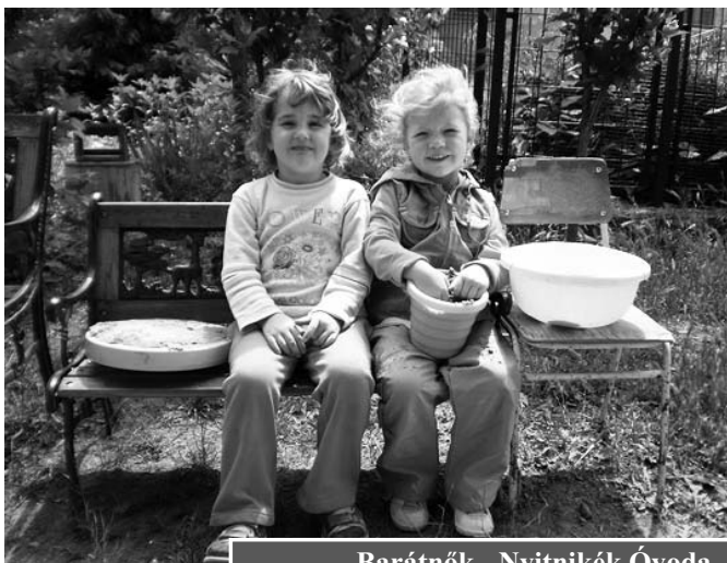
Barátnők - Nyitnikék Óvoda

A bizottság mérlegli, hogy kik azok, akiket kötelező felvenni. Kötelező a felvétel a tanköteles illetve óvoda-köteles korú gyermekek esetében, akik az adott nevelési évben ötödik életévüket betöltik, valamint gyermekvédelmi indokok alapján. Ezekbe a kategóriába a jelentkezők közül 6 gyermek tartozott bele.