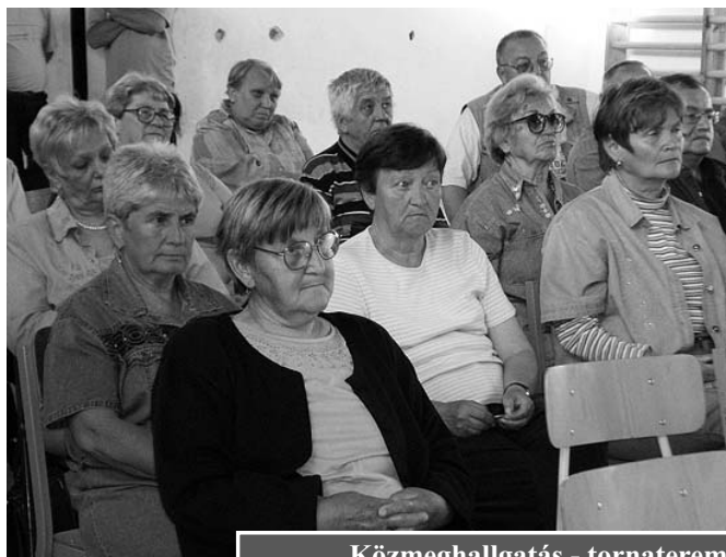
Közmeghallgatás - tornaterem

A továbbiakban a testület 500.000.- Ft-ot a Polgármesteri Hivatal külső hőszigetelési munkálatainak elvégzésére, 174.000.- Ft-ot a Faluházban szükséges pótmunkák elvégzéséhez biztosított a tartalékalap terhére.