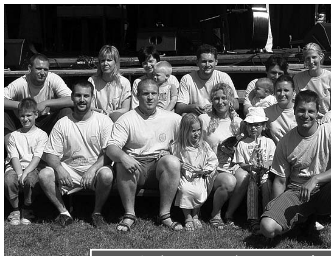
A szigetmonostori csapat egy része

Természetesen büszkén vittük a falu lobogóját a Szentendrén átvonuló zöldség felvonuláson, amely a nem éppen rövid táv és a nagy meleg ellenére különleges élményt nyújtott.