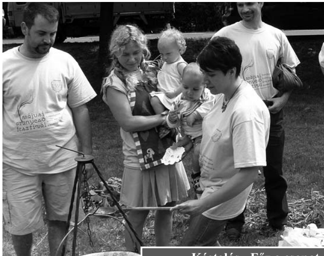
Kóstolás - Főz a csapat

Összességében elmondhatjuk, hogy nagyon gazdag és emlékezetes élményben volt részünk, amelyet csak emel a Szigetmonostort képviselő legnépesebb csapat aktív részvétele, a csapaton belül a gyermekek magas aránya és a főzőversenyen elért győzelem.