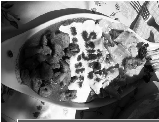
A szigeti halvarázs - A Kistérség legjobb étele

Első lépésként a harcsapaprikás alapjához a hagymát és a paprikát zsiradékon együtt megdinszteljük, majd hozzáadjuk az apróra vágott fokhagymát, az őrölt pirospaprikát és végül a felkockázott paradicsomot. Megsózzuk, hogy a zöldségek levet eresszenek, majd nagyjából félórát főzzük. Eközben a filézett és felkockázott harcsát besózzuk és megborsozzuk. Az elkészített alaplevet paradicsompasszírozón áttörjük (erre a célra botmixert is használhatunk). Az alaplevet még egyszer felforraljuk, majd beletesszük az előkészített halat és mintegy 10-15 perc alatt készre főzzük, amelynek végén 5 dl tejjel behúzzuk és szükség esetén sózzuk, borsozzuk.