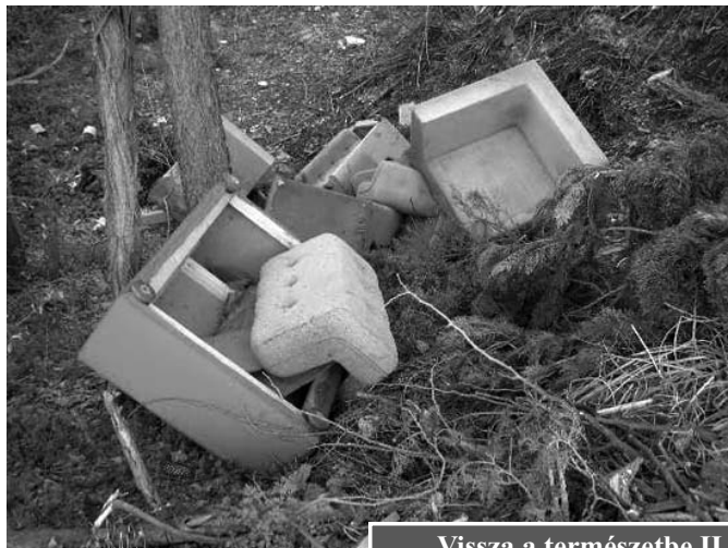
Vissza a természetbe II.

Ahogy a mellékelt fényképek mutatják valakik nem tudják, hogy mit lehet, és mit nem. Tudom nehéz a megoldás, de talán lehetne tiltó táblát kihelyezni, Polgárórség gyakoribb ellenőrzését ebben a kis zsák utcában, és lomtalanításakor a teherautó is bekanyarodhatna oda. A hely a nem aszfaltozott Vadvirág utcából nyílik, ahol a telefonközpont (úgy tudom az) van. Köszönettel az ott nyaralók (köztük a szüleim) nevében is!