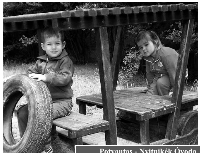
Potyautas - Nyitnikék Óvoda

„Kérem, szíveskedjenek átgondolni a lehetséges megoldásokat, hiszen évek óta jelzem a létszám emelkedését, viszont a jelen gazdasági helyzetben egyre több szülő áll munkába, így az otthon maradó anyukák száma az évek során jelentősen csökkent. Egyszerűbb szükség van a gyermekek intézményi elhelyezésére, így az óvoda felé fokozatosan nő az elvárás, igen nagy nyomás nehezedik az intézményre ilyen döntések meghozatala előtt, hiszen családok sorsát befolyásoljuk.”