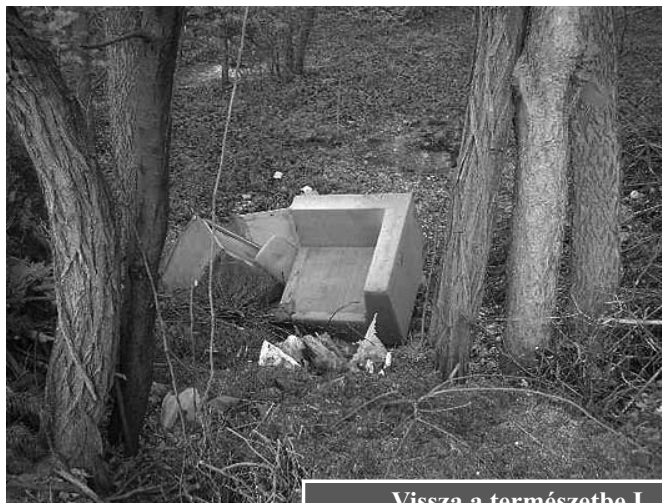
Vissza a természetbe I.